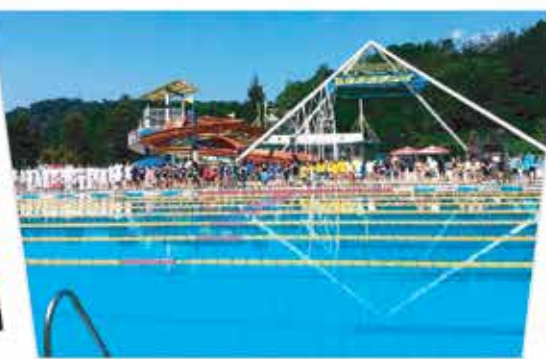
Sport i zabava