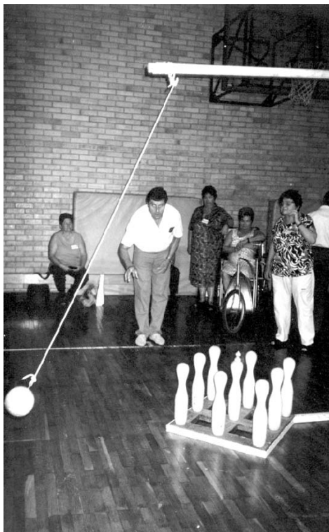
• Sa susreta invalida u Daruvaru

Susreti su održani 14. lipnja u prostorima Daruvarskih toplica u hotelu "Termal" u Daruvaru, gdje su i održane športske aktivnosti.