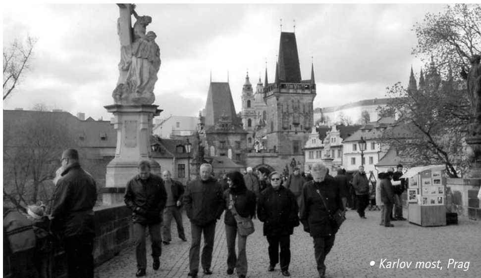
• Karlov most, Prag

Kroz navedeno razdoblje našeg boravka u Republici Češkoj, imali smo prilike upoznati i bogatu Češku povijest, brojne kulturne znamenitosti, prekrasnu arhitekturu, a naročito nas se dojmila svekolika briga i pažnja koju posvećuju osobama s invaliditetom.