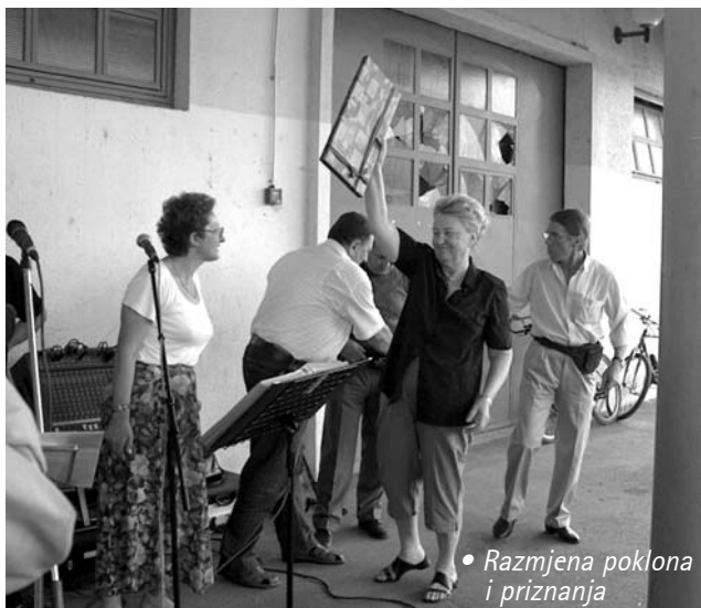
• Razmjena poklona i priznanja