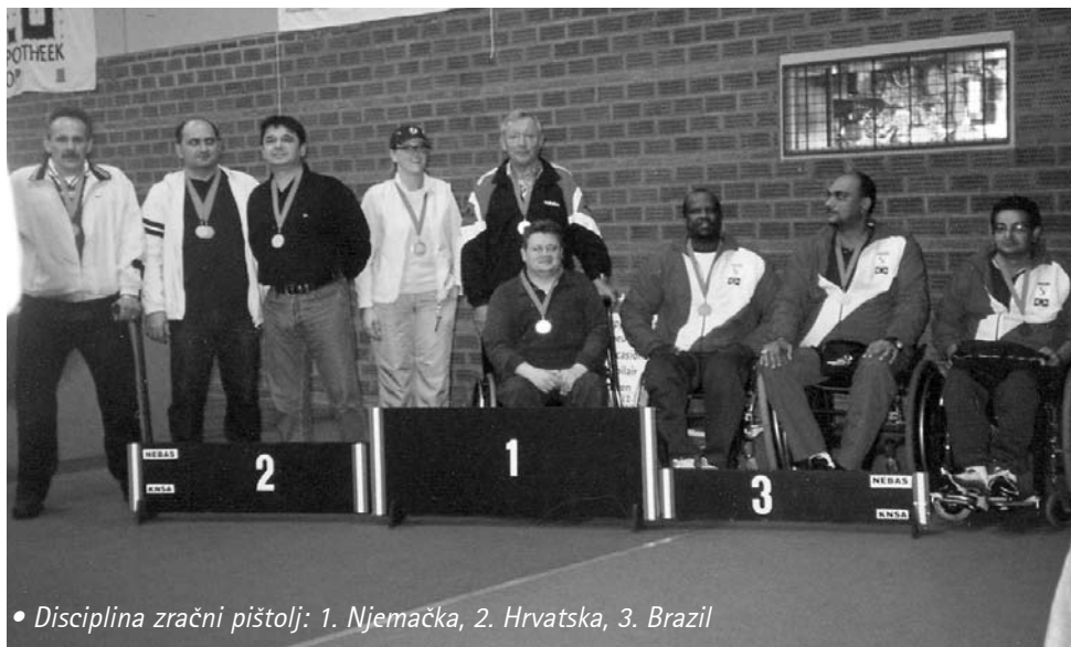
• Disciplina zračni pištolj: 1. Njemačka, 2. Hrvatska, 3. Brazil