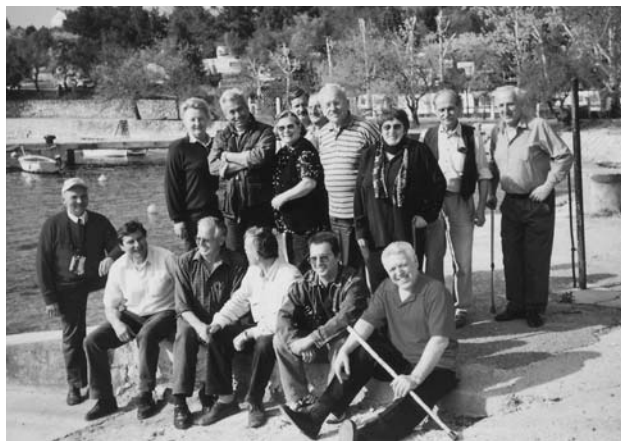
• Sa zajedničkog obilaska odmarališta

U vezi sa navedenim, naši članovi mogu detaljnije informacije dobiti u Udruzi osobno ili putem naših telefona.