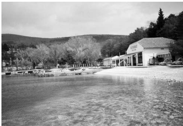
Plaža i odmaralište u Selcu •

Zbog izraženih potreba i želja naših članova za organiziranje ljetovanja na moru pod povoljnijim uvjetima, ove smo godine zakupili dio odmarališta u istom