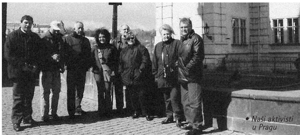
• Naši aktivisti u Pragu

Program našeg posjeta bio je vrlo naporan i raznovrstan, a naši češki suradnici ponovno su nam iskazali svoju gostoljubivost i prijateljstvo. U nizu razgovora i dogovora o zajedničkoj suradnji vrijedno je istaknuti već spomenute prijedloge za organiziranje