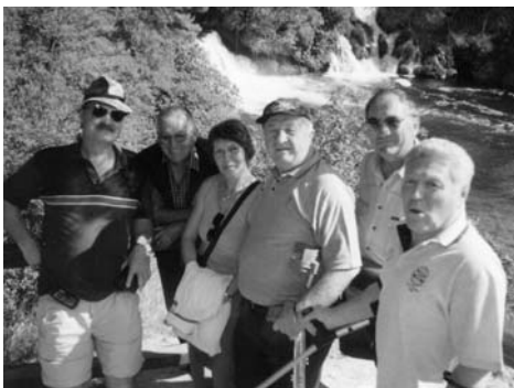
• Posjet Nacionalnom parku "Krka"