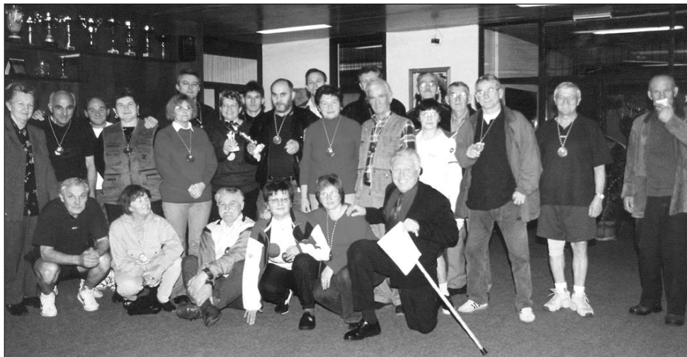
• 'Veselje nakon primljenih medalja i pehara'

Želim se na kraju zahvaliti svim članovima na ovogodišnjim sportskim rezultatima i fair-play ponašanju -