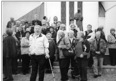
• Ispred crkve u Krašiću