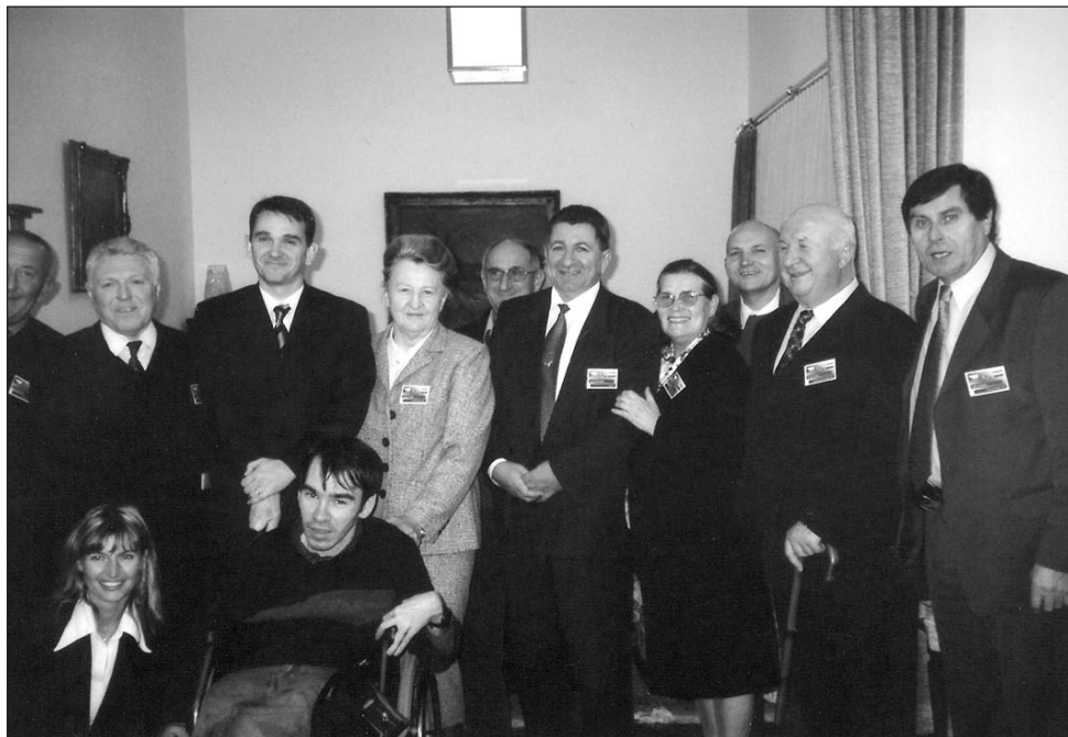
• na prijemu u Veleposlanstvu Češke Republike

organizacije ORFEUS, a razlog je veća suradnja. U tom smislu su organizirali i prezentaciju njihovih proizvoda ortopedskih pomagala koja su u svakom slučaju vrlo zanimljiva, a bila bi i korisna i za naše osobe s invaliditetom.