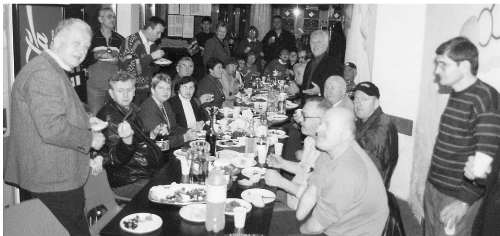
• "Zajedničko druženje nakon osvojenih medalja i pehara"