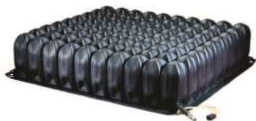
Roho jastuk (1 ventil)