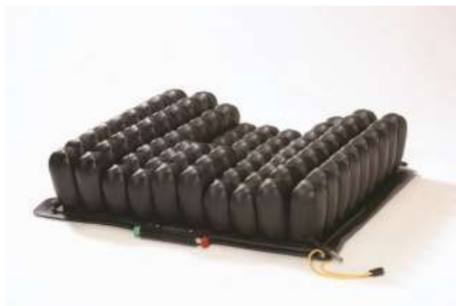
Roho Contour Select