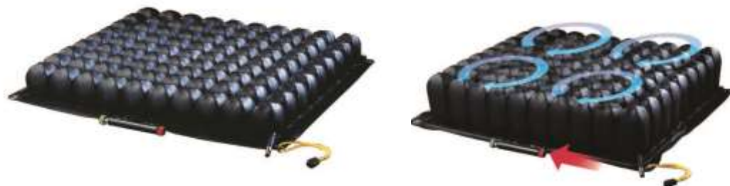
Roho Quadro Select