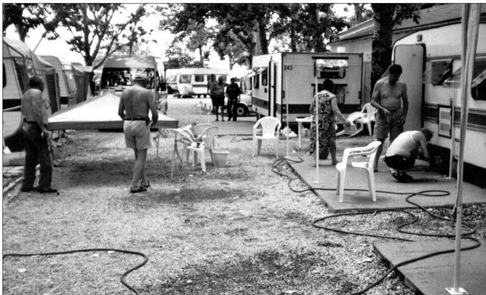
• auto-kamp "Uvala Slana"

Na žalost, nismo bili u mogućnosti svima udovoljiti jer su kapaciteti za naše brojno članstvo premali, ali se nadamo u idućoj godini još proširiti akciju, stoga molimo za razumijevanje.