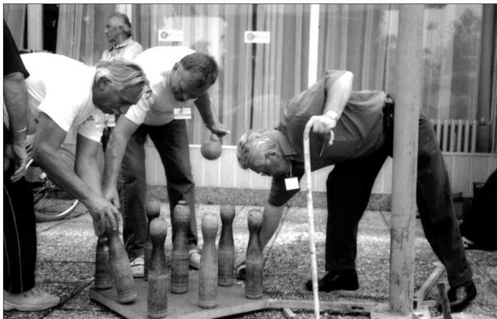
• sa druženja u Križevcima